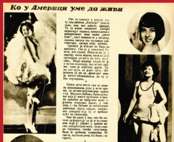
▲ „Ilustrovano Vreme“, 20.12.1930.