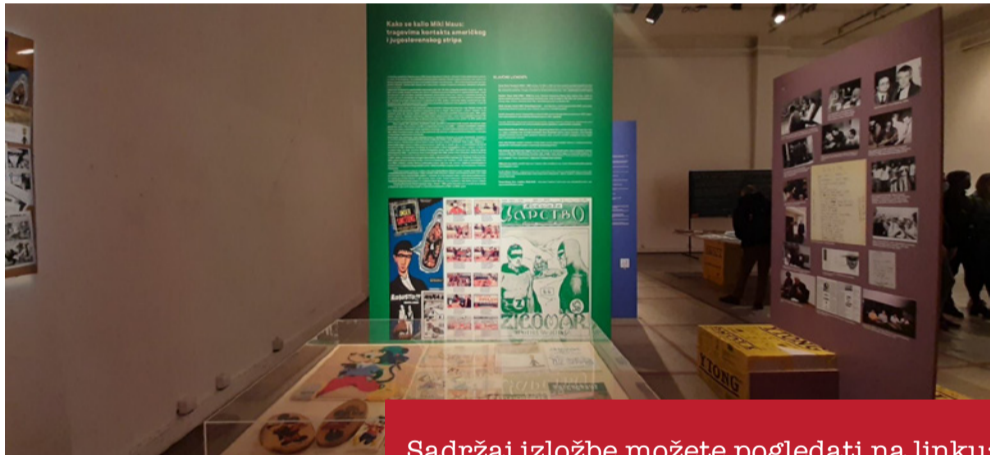
Sadržaj izložbe možete pogledati na linku: https://www.upsdownshighslows.com/sr/