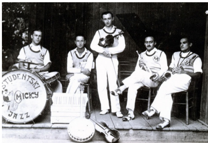
◀ „Studentski Mickey Jazz“ orkestar, 1927.

Džez se u međuratnom Beogradu slušao na mestima poput „Kasine“ ili „Džokej kluba“, a zainteresovani za najmodernije plesove poput čarlstona i black bottom-a, pohađali su časove u studiju Petra Stojića pored „Kasine“.