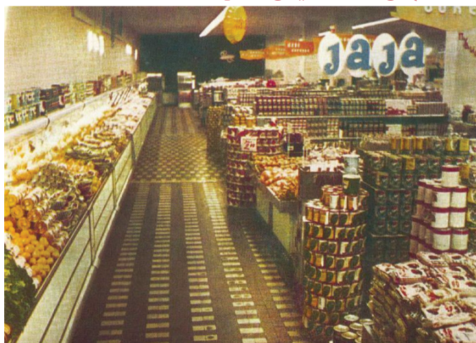
▼ Samoposluga „Cvetni trg“