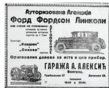
▲ Politika, 26.4.1925.