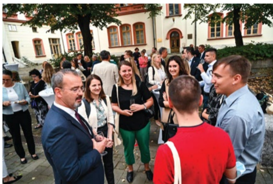
▲ Ambasador SAD E. Godfri u razgovoru sa studentima Centra za američke studije