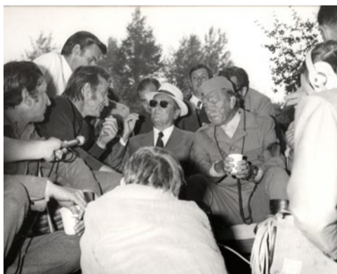
▲ Josip Broz Tito i Ričard Barton na snimanju „Sutjeske“, septembar 1971

Ričard Barton i Elizabet Tejlor, jedan od najpoznatijih holivudskih parova, bili su česti gosti u Jugoslaviji početkom sedamdesetih, tokom snimanja filma „Sutjeska“. Barton je u ovom filmu igrao nikog drugog do Josipa Broza Tita iz vremena jedne od najvećih bitaka Drugog svetskog rata na jugoslovenskom prostoru. Već i sama činjenica da je Barton glumio u filmu govori o spektakularnosti „Sutjeske“, kao jednom od najskupljih evropskih filmova tih godina. Pre početka snimanja filma, Ričard Barton i Elizabet Tejlor doputovali su na Brione (avgust 1971) kako bi se upoznali sa Titom i Jovankom Broz. Ovom prilikom holivudski par je u pratnji Tita i Jovanke posetio Pulski filmski festival, a samo par meseci kasnije (septembar 1971), u pauzi od snimanja, Barton i Liz Tjelor posetili su i Filmske susrete u Nišu.