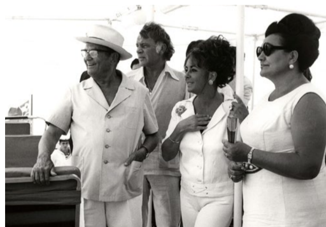
▲ Tito, Ričard Barton, Elizabet Tejlor i Jovanka Broz na Brionima, avgust 1971, Muzej Jugoslavije

Štampa iz 1971. prenosila je Bartonovo oduševljenje ponudom da igra, kako navode, „možda najinteresantnijeg državnika u svetu“. Međutim, Bartonovi dnevници, objavljeni 2012, svedoče o nešto drugačijim utiscima holivudske zvezde. Glumac zapaža raskoš u kojoj žive Tito i Jovanka Broz, kritikujući strah koji Brozovo prisustvo uliva posluzi u njegovoj vili. Zanimljivo je kako Barton poredi popularnost svoje supruge i predsednika Jugoslavije, ističući da su oboje dobili neverovatne ovacije prilikom posete Puli. Naravno, Bartonove opaske tokom boravka u Jugoslaviji nisu bile sasvim negativne. Uprkos početnoj nesigurnosti koju je imao tokom snimanja „Sutjeske“, glumac naglašava kako je veoma zavoleo Jugoslovane. O tome svedoči i intervju koji je dao za jedan jugoslovenski časopis, kada je na pitanje da li bi ponovo snimao jugoslovenski film, Barton odgovorio da bi radije živeo u Jugoslaviji.