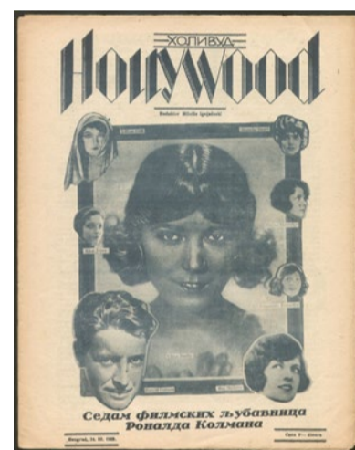
▲ „Hollywood“ 24. mart 1928. ◀ „Ilustrovani list“ 28. jul 1928.