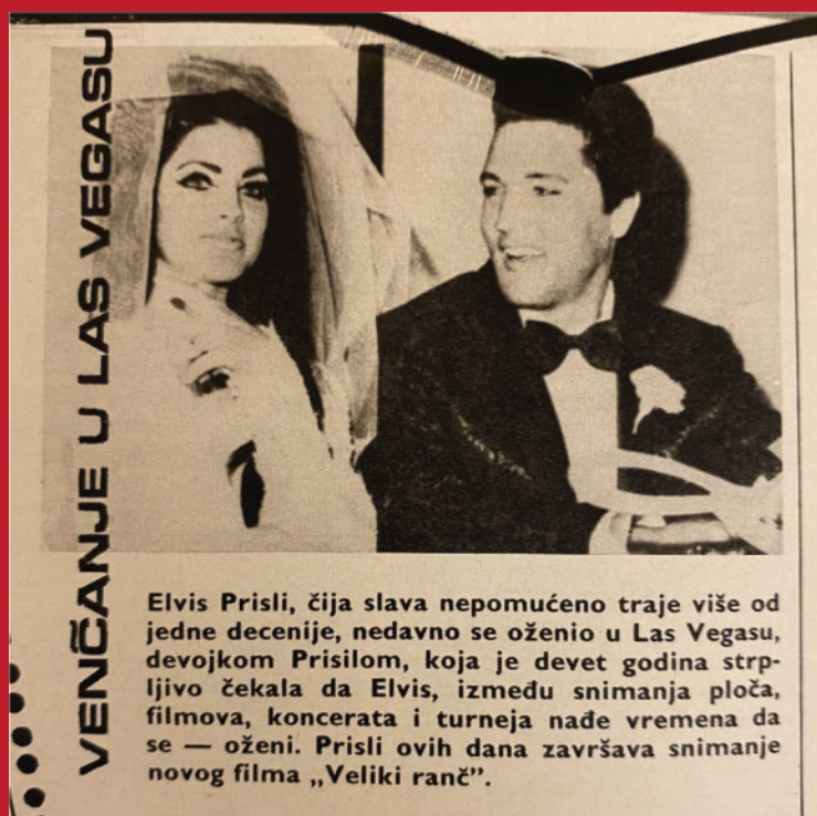
▲ „Džuboks“, 3. avgust 1967.