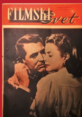
▲ „Filmski svet“, br. 55, 1956.