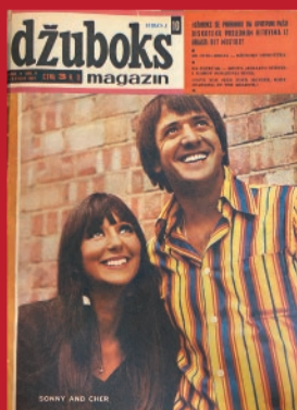
▲ „Džuboks“, 3. februar 1940.

Projekat „Američka istorija u učionici: amerikanizacija Srbije u hladnom ratu“ Centar za američke studije započeo je u oktobru 2022. godine. U tekućoj fazi projekta istraživači Centra i Narodne biblioteke Srbije listaju štampu iz kolekcije Narodne biblioteke u potrazi za primerima amerikanizacije i srpsko-američkih odnosa u hladnom ratu. Ovde smo postavili izabrane isečke iz dosadašnjeg istraživanja.