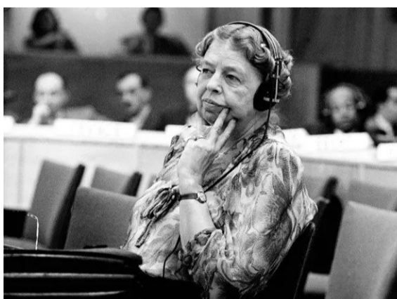
▲ Eleonora Ruzvelt u sedištu Ujedinjenih nacija u Njujorku

Decembar se globalno obeležava kao Mesec ljudskih prava, s obzirom na da to je Univerzalna deklaracija o ljudskim pravima u Ujedinjenim nacijama doneta 10. decembra 1948. godine, te se tako i u SAD tokom ovog meseca velika pažnja posvećuje pitanju jednakosti. Važno je napomenuti i da je tokom donošenja Deklaracije, Eleonora Ruzvelt bila predsedavajuća Komisije za ljudska prava u Ujedinjenim nacijama.