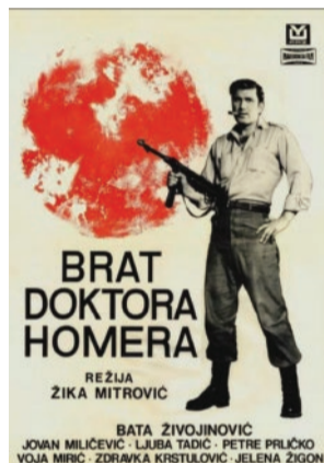
▲ Izvor: IMDB

Iz njegovog dela mogu se izdvojiti ratni spektakli, „Užička Republika“ i „Marš na Drinu“, i jugoslovenski westerni „Kapetan Leši“, „Ešalon doktora M.“ i „Brat doktora Homera“. Vredi naglasiti da je Mitrović o westernu kao žanru učio i u poseti Sjedinjenim Državama, gde se susreo sa brojnim istaknutim holivudskim producentima, režiserima i glumcima, poput Džordža Stivensa i Marlona Branda. Mitrovićevo delo je nedvosmislen primer američkog uticaja u posleratnoj Jugoslaviji, ali i autentični izraz jugoslovenske filmske kulture, u kojoj su promovisane vrednosti socijalističkog društva u nastajanju.