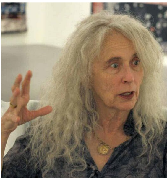
▲ Kiki Smit

U utorak 6. decembra u 18h u svečanoj sali „Dragoslav Srejović“ Centar za američke studije organizovaće razgovor o stvaralaštvu Kiki Smit, o značaju njene izložbe „Ljudi i ostale životinje“ za našu sredinu, zašto je saradnja sa svetski renomiranim umetnicima poput same Smit važna i korisna za lokalnu sredinu i umetnost. Takođe, biće reči i odnosu publike prema njenim delima, kao i reakcijama same umetnice na veliku posećenost. Konačno, u razgovoru će osim fokusa na samu izložbu u Beogradu, biti i pokušaja da se pokaže relevantnost i aktuelnost njene delatnosti koja je dovela do toga da je magazin „Time“ svrsta u „TIME 100: Ljudi koji oblikuju naš svet“. U razgovoru će učestvovati istoričarke umetnosti Ljubica Vujović i Lea Stanković.