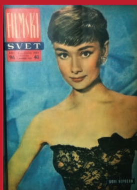
▲ „Filmski svet“, br. 96, 1956.